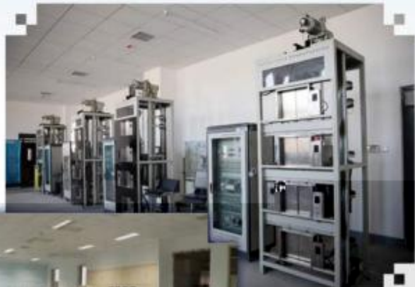
智能电梯安装调试维护训练场所