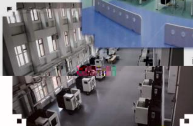
DMG 数控技术训练场所